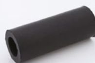
2 x gummidistans